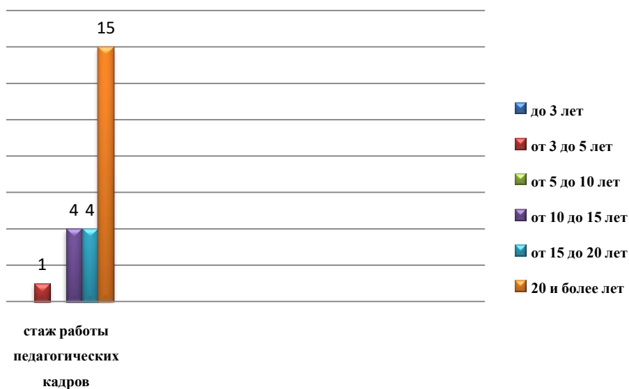
Диаграмма с характеристиками кадрового состава детского сада

На 01.01.2020 года 1 педагог проходит обучение в ВУЗе по педагогической специальности.